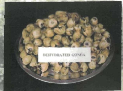
गुन्ना के सुखाए हुए फल

गून्दे के फलों को सुखाकर परिरक्षित करना बहुत ही सरल है। सबसे पहले गून्दे के फलों को डण्टल सहित पानी में उबाल ले। जब फल दबाने से मुलायम महसूस होवे तब पानी से बाहर निकालकर पंखे के नीचे इस तरह सुखाएँ कि फलों के चारों ओर कहीं भी पानी की बून्दें नजर नहीं आवें। जब फल ठण्डे हो जाएँ तब इसके डण्टल अलग करके एक-एक फल को अंगूठे व अंगुलियों के बीच दबा कर गुठली अलग कर लें। अब इन्हें धूप या बिजली चालित ड्रायर या सौर ड्रायर में तब तक सुखाएँ जब तक फल हाथ से दबाने पर टूटने लगे तथा कुर-कुरे मालूम हों। इस अवस्था में इनको पॉलीथिन में पैक करके भण्डारण करें।