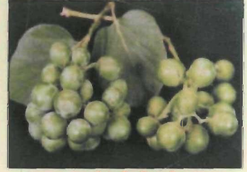
गुन्ना फल तोड़ाई की सही अवस्था

बढ़वार पूर्ण कर चुके फलों के गुच्छों को हरी अवस्था में ही तोड़ना चाहिए। फलों की तुड़ाई मध्य मार्च से मध्य मई तक चालू रहती है। इसके पश्चात् फल पक कर पीले पड़ने लगते हैं जो कि सब्जी या अचार के लिये उपयुक्त नहीं रहते हैं क्योंकि वे लिसलिसे तथा मिठास लिए हुए होते हैं। फलों को हमेशा गुच्छों में ही तोड़ना चाहिए ताकि तुड़ाई पश्चात् काफी समय तथा ताजे बने रहें। उत्तम प्रबंधन कर एक पेड़ से औसतन 20-50 किग्रा फल प्राप्त किये जा सकते हैं। अलग-अलग वर्षों में इसका उत्पादन कम या ज्यादा होता रहता है इसका निर्धारण मुख्य रूप से किस्म तथा फूल आने तथा फल बनते समय मौसम की स्थिति पर निर्भर करता है। काजरी में किये गये अनुसंधान के आधार पर यह पाया गया है कि केवल कुछ माह के लिए पूरक सिंचाई की व्यवस्था करके इससे 20-50 किलो फल प्रति वृक्ष प्राप्त कर सकते हैं।