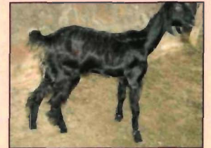
खूनी दस्त से ग्रसित बकरी

यह बीमारी 1 से 4 महीनों के बच्चों में एक अन्तः परजीवी के कारण होती है। इस बीमारी के लक्षणों में तीव्र खूनी-दस्त, भूख न लगना, शारीरिक भार में गिरावट, रक्तहीनता आदि प्रमुख हैं। एक ही बाड़े में सीमित संख्या से अधिक बच्चे व फर्श के गीला होने से इस बीमारी में बढ़ोत्तरी हो जाती है। इससे बचाव के लिए फर्श की सफाई के साथ-साथ खाने व पानी की जगह को भी साफ रखना अति आवश्यक है। पशु चिकित्सक की सलाह से इस रोग हेतु काम आने वाली एम्प्रोलियम व मोनेन्सिन आदि दवाइयों का उपयोग इस बीमारी के बचाव के लिए बरसात के मौसम के पहले किया जा सकता है।