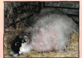
कीटोसिस से ग्रसित भेड़

यह बीमारी उन मादा पशुओं के गर्भकाल की अन्तिम तिमाही में व ब्याने के बाद सम्भावित है, जिनके गर्भ में दो या अधिक भ्रूण विकसित हो रहे हैं अथवा शारीरिक दृष्टि से अत्यधिक कमजोर हैं। ऐसा इन पशुओं में ऊर्जा की कमी, कार्बोहाइड्रेट के उपायचय में गड़बड़ी तथा रक्त में कीटोन पदार्थों का बनना है। पशु के श्वास से एक विशेष प्रकार की मीठी गंध का