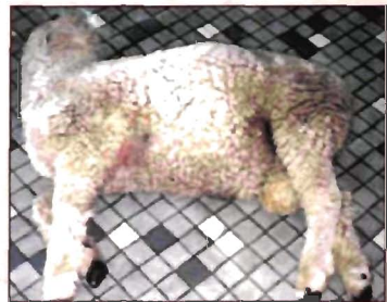
फड़किया से ग्रसित भेड़

यह बकरी व भेड़ में पाया जाने वाला मुख्य जीवाणु जनित रोग है। इसके रोगाणु मृदा एवं पशु की ग्रास नली में अपनी प्राकृतिक अवस्था में पाये जाते हैं। इस बीमारी की चपेट में आए पशु की मृत्यु प्रायः चरते-चरते मौके पर ही अथवा 36 घन्टों के दौरान हो जाती है। इस बीमारी के प्रारम्भिक लक्षण: खाना-पीना छोड़ देना, चक्कर आना तथा खूनी दस्त करना हैं। पशु चारे में परिवर्तन या अत्यधिक मात्रा में भोजन ग्रहण करना इस बीमारी को बढ़ने में सहायता प्रदान करते हैं। इस बीमारी के निम्न उपचार के उपरांत पशु एक सप्ताह में ठीक हो जाता है। पशु के प्रभावित होने पर लगभग आधे कप पानी में लाल दवा के 1 या 2 दाने घोलकर पिला दें। गर्भवती बकरी व भेड़ (गर्भधारण का अन्तिम महीना) तथा 3 महीने से ऊपर के बच्चों का टीकाकरण करके इस बीमारी से बचा जा सकता है।