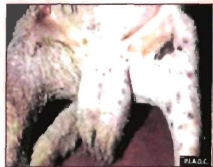
चेचक से ग्रसित भेड़

यह एक विषाणु जनित रोग है जिसमें पशु के मुँह, नाक, थन पर तथा पिछली टागों के मध्य छाले बन जाते हैं। इससे पशु को बहुत खुजली होती है। यह छाले पकने के बाद झड़ जाते हैं तथा उनके निशान बन जाते हैं। लेकिन इस रोग से ग्रसित पशु की मृत्यु नहीं होती है। सही समय पर टीकाकरण ही इसका एक सफल बचाव है।