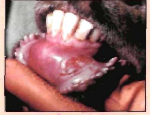
खुरपका-मुँहपका से ग्रसित पशु

यह तीव्रता से फैलने वाली एक विषाणु जनित बीमारी है। इस रोग के मुख्य लक्षणों में मुँह में तथा खुरों के मध्य छाले बनना, लँगड़ा कर चलना, भोजन न करना, तीव्र बुखार एवं गर्भपात आदि हैं। पशु की वृद्धि दर कम हो जाती है। लेकिन मृत्यु बहुत ही कम पशुओं में होती है। इस रोग के विषाणु आपसी स्पर्श व वायु द्वारा फैलते हैं। पशु के मुँह में फिटकरी तथा खुरों पर नीले थोथे का घोल लगाने से पशु को आराम मिलता है। इस बीमारी से ग्रसित होने के पश्चात् पशु स्वतः ही ठीक हो जाता है। प्रत्येक छः महीने पश्चात् टीकाकरण ही इस बीमारी से प्रमुख बचाव है।