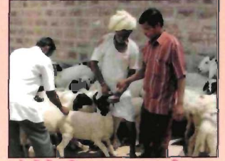
भेड़ों में कृमि नाशक दवा का पिलाना

यह परजीवी इन पशुओं में गम्भीर समस्या पैदा करते हैं। ये इनका रक्त चूसते हैं तथा खनिज लवण व विटामिन की कमी पैदा करते हैं। ऐसा होने से पशु कमजोर हो जाता है, वृद्धि रुक जाती है, गुहा पतली हो जाती है एवं उसमें से बदबू आती है। इन परजीवियों से बचाव के लिए पशुओं को समय-समय पर पशु चिकित्सक की देख-रेख में कृमिनाशक (एल्बेन्डाजोल/फेनबेन्डाजोल आदि) घोल देना चाहिए। लगभग 250 ग्राम ओक के फूलों को 500 मि.ली. पानी में उबालकर पिलाने से पेट के कीड़े बाहर आ जाते हैं।